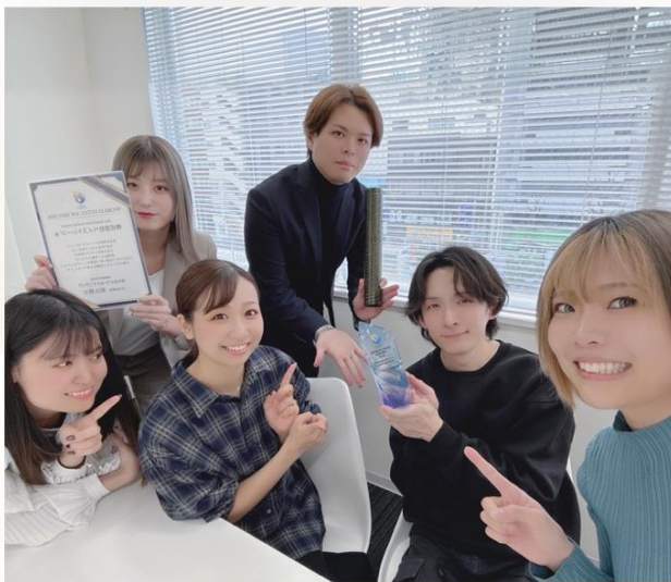
大阪支社のメンバー

このたび株式会社ペイストレージは、株式会社ワールドインテック※1主催のパートナー企業表彰にて「Key Assignment Success Award※2」を受賞いたしました。