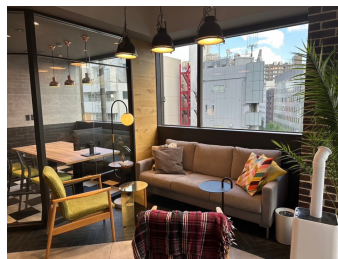
フラットスペース

スタンディングミーティングによって発言が活発になったり健康面や眠くなりにくいなどのメリットがあり定期的に導入しております。