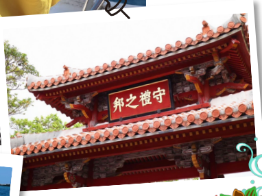
パワースポットめぐり!